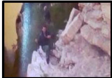
Punto di calata